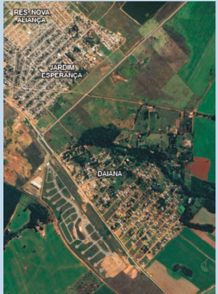
Mudança também seria feita na divisa com município de Silvânia; gestores das cidades envolvidas já realizaram encontro preliminares