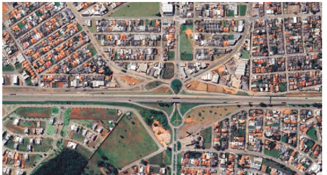
O Viaduto Ayrton Senna, que liga o Anápolis City ao Bairro de Lourdes, também é considerado problemático

zação no sistema de semáforos, para identificar onde há o maior volume de veículos, aumento de faixas de rolamento e até mesmo alterar a via para mão única.