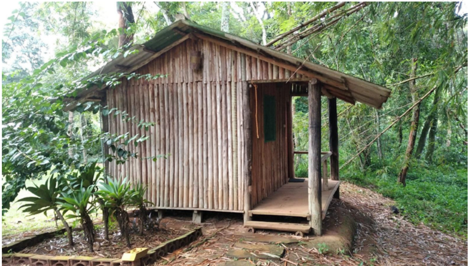
Rusticidade: Santa Branca tem uma aconchegante cabana disponível para hóspedes

Por lá, a ideia é fazer com que as pessoas convivam em harmonia com o bioma Cerrado. De acordo com os proprietários, preza-se no espaço por um ambiente familiar, em que