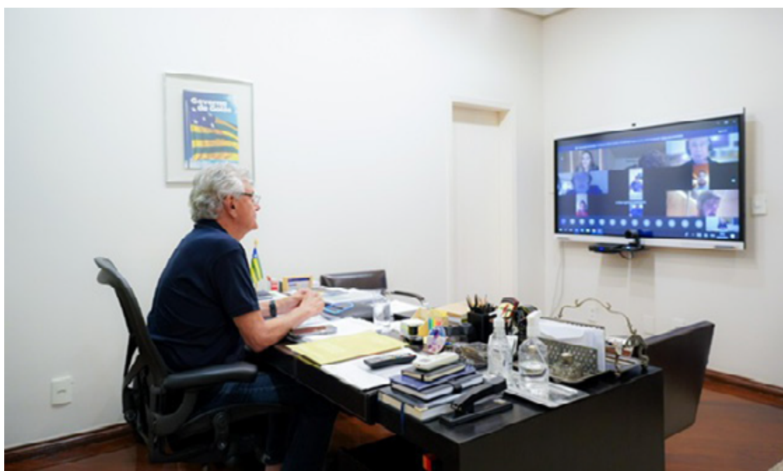
Ronaldo Caiado: respaldo à decisão do União Brasil de expulsar Chiquinho Brazão

“A Comissão Executiva Nacional do União Brasil aprovou por unanimidade o pedido cautelar de expulsão com cancelamento de filiação partidária do deputado federal Chiquinho Brazão. A representação foi apresentada pelo deputado federal Alexandre Leite (UNIÃO-SP) e relatada pelo senador Efraim Filho (UNIÃO-PB).