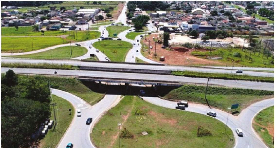
Diretoria de trânsito aponta entroncamentos com rodovias como principais gargalos, em especial BRs 414 e 153

De acordo com o diretor, tanto a CMTT, quanto a Prefeitura de Anápolis tem trabalhado para resolver os problemas internos para dar mais fluidez ao trânsito, como a proibição de estacionar nas vias de grande movimento, moderni-