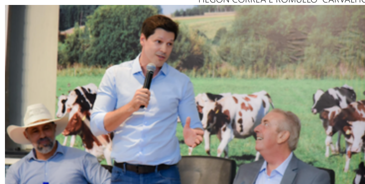
Daniel Vilela, vice-governador, elogia medidas adotadas por Ronaldo Caiado