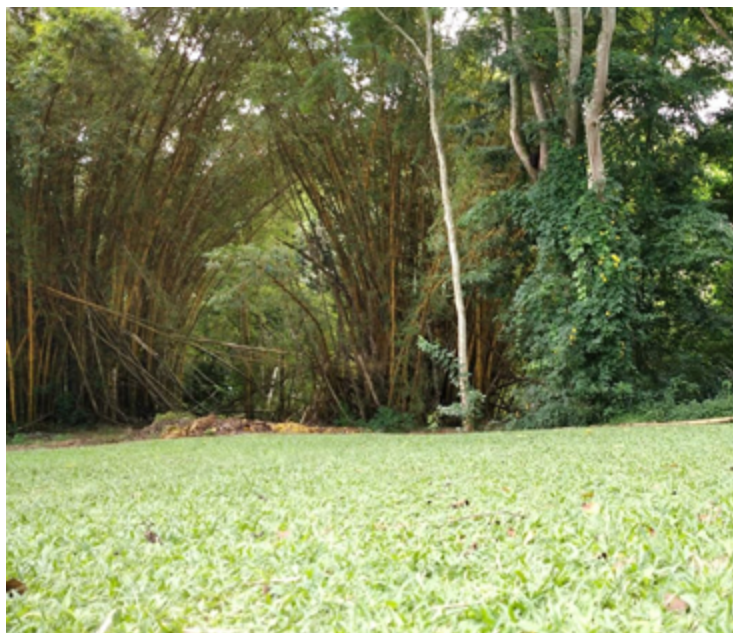
Verde: pousada coloca turista em contato com sons da fauna

a paz reina, boa receptividade é regra e alegria se espalha dentre hóspedes de diferentes idades. De fato, o repórter observou ali crianças sorridentes pulando na piscina, pais conversando uns com os outros e senhores de cabelo branco aproveitando a família.