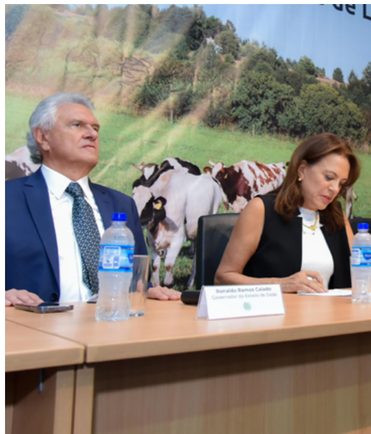
Ronaldo e primeira-dama Gracinha Caiado durante encontro com integrantes da Faeg: reação do Governo de Goiás para atender produtores

“Já destacamos R$ 10 milhões para aquisição do leite de áreas de assentamento, como também de pequenos produtores para receberem o leite, que será tratado por várias indústrias de Goiás e repassado para áreas carentes. Além disso, foram autorizados R$ 3 milhões para a aquisição de sêmen e embriões para melhorar a qualidade do padrão genético do nosso gado”.