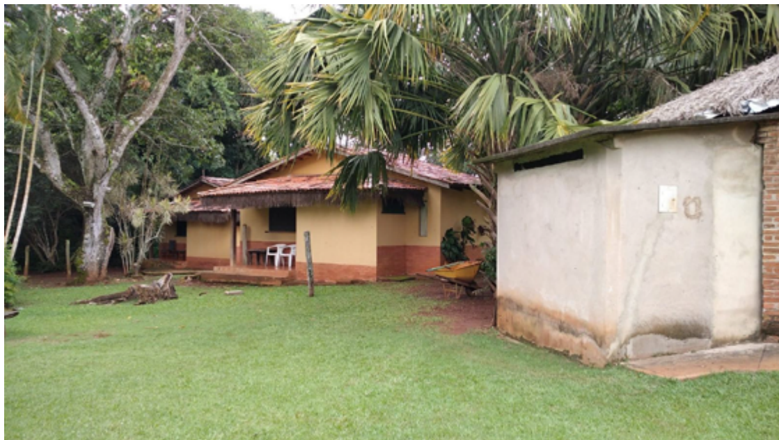
Chalés: acomodação conta com ar-condicionado e frigobar