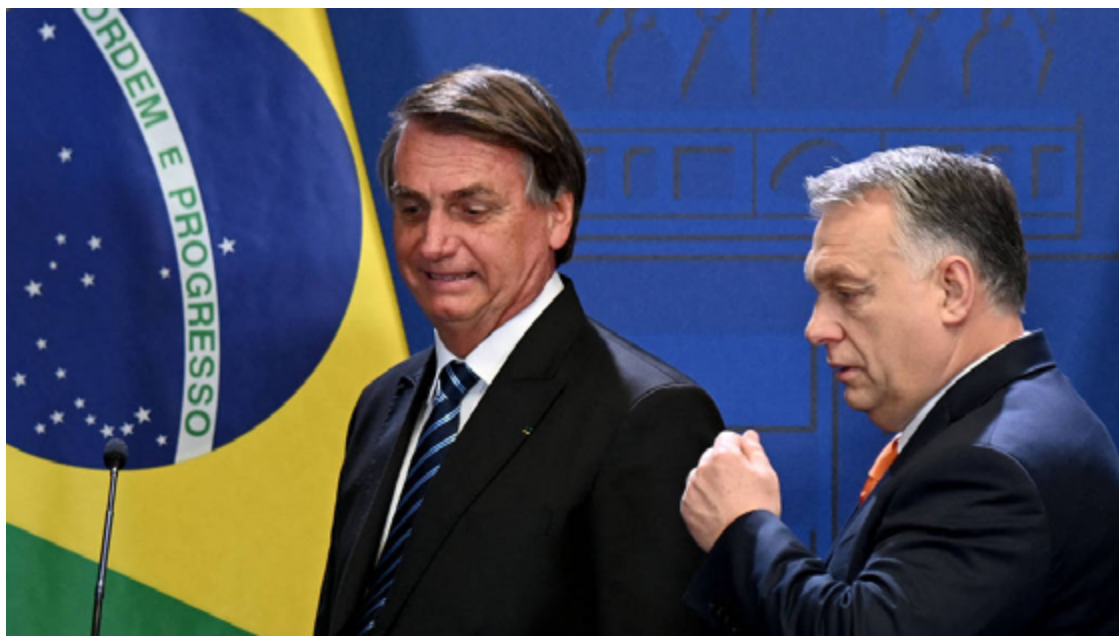
Jair Bolsonaro e Viktor Orbán; aliados políticos e afinidade ideológica

Em paralelo ao investimento do governo húngaro na construção de um soft power veio o desmonte da democracia húngara. O primeiro-ministro governa desde 2010 com uma maioria de dois terços do Parla-