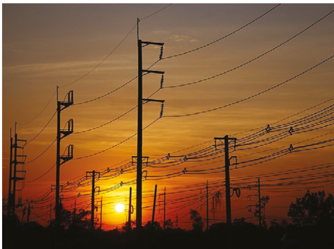
Entre os itens que consomem mais energia estão: ar condicionado, ventilador, geladeira, freezer e bebedouros