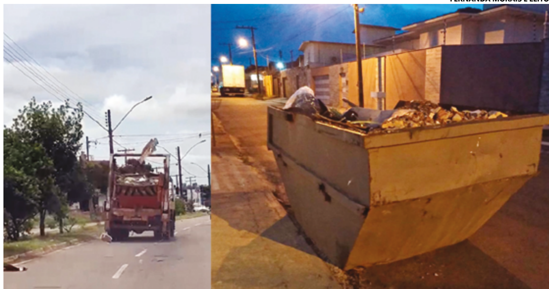
Caçamba derrama lixo na Avenida Ayrton Senna e outra sem sinalização próximo ao Feirão do São Jorge