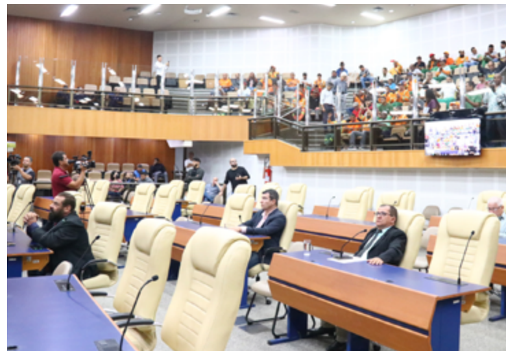
Câmara de Goiânia: vereadores perdem mandatos