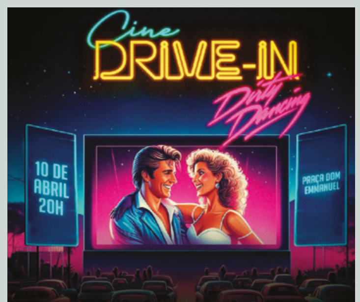
Filme será exibido no dia 10 de abril, o acesso é gratuito e motoristas devem seguir as instruções dos manobristas que estarão no local

No verão de 1963, a jovem Baby (Jennifer Gray), passa as férias com os pais em um resort. Uma noite, ela segue até o alojamento dos funcionários do lugar, encantada pela música que vinha de lá. É onde encontra Johnny (Patrick Swayze), o instrutor de dança do hotel, um homem experiente e cheio de charme. Desse encontro, surge um inevitável romance entre os dois. Um romance que chega entre muitas aulas de dança e ensinamentos de amor.