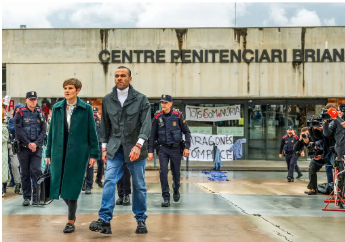
Ex-jogador de futebol Daniel Alves, condenado por estupro na Espanha, sai da prisão após pagar fiança de 1 milhão, o equivalente a R$ 5,5 milhões

O caso aconteceu em 30 de dezembro de 2022, na boate Sutton Barcelona. Conforme a denúncia, Alves a forçou a fazer sexo no banheiro da área VIP. Em 22 de fevereiro deste ano, o brasileiro foi condenado a 4 anos e meio de prisão, mas a sentença final ainda depende de que as partes esgotem os recursos.